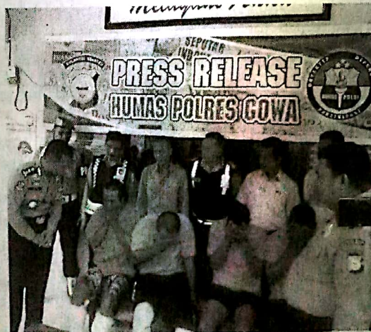
SINDIKAT. Aparat Polsek Bontomarannu berhasil menangkap empat orang pelaku pencurian ternak yang biasa beraksi di wilayah hukum Polres Gowa.

Dari pengakuan tersangka, sapi yang mereka curi tersebut kemudian dijual seharga Rp9 juta sampai Rp10 juta setiap ekornya kepada penadah dan adapula yang dijual perkilo dengan harga Rp90 ribu setelah dipotong-potong. (sof/rls)