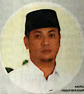
MASRUK / RADAR MAKASSAR

Tentunya aspek yang diperhati-kan dalam pelaksanaan evaluasi terhadap hasil pelaksanaan rencana pembangunan adalah keberhasilan. Untuk dapat menilai aspek keberhasilan ini, dilakukan melalui penilaian terhadap pencapaian sasaran