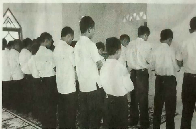
SHALAT BERJAMA'AH. Siswa SMPN 4 Pallangga sedang melaksanakan Shalat Dhuha di mushallah sekolahnya sebelum pelajaran pertama dimulai.

Koran / Majalah : HARIAN RAKYAT SULSEL Tanggal / Minggu : 1 FEBRUARI 2018 Halaman / Kolom : 15/2 - 3